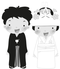
mít svatbu: kluk se žení, holka se vdává