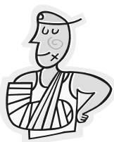
mám zlomenou ruku