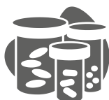
tablety, pilulky, pastilky