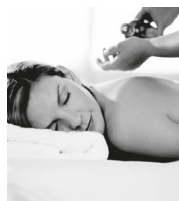
bolí mě krk a záda