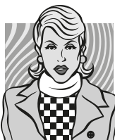
bolí mě v krku