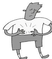
bolí mě břicho