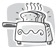
bílý toustový chleba

Pečivo: chleba + rohlíky + housky + koláče