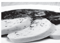
maso a knedlíky