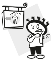
bolí mě zub