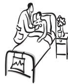
Doktor nosí bílý plášť.

Líbí se mi = Mám rád/a sportovní oblečení.