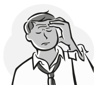
bolí mě hlava