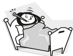
mám horečku – ležím v posteli